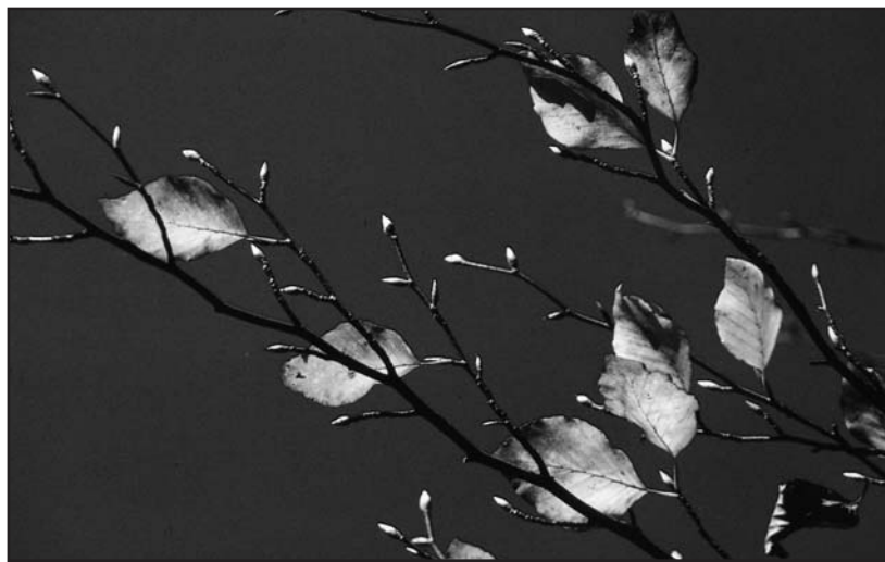
RAMI DI FAGGIO. Il faggio è prezioso. Il tronco non troppo alto e rifinito con nettezza nella forma, come avviene spesso per i faggi. Per me era già da sempre come se essi avessero alcunché di benedettino; qualcosa di vigoroso e mite a un tempo; naturale e tuttavia interamente portato a perfezione. Tutto è saturato di forma, dal tronco fino al più sottile ramoscello (Foto e testo da Contemplazione sotto gli alberi , di Romano Guardini, Morcelliana, Brescia, 2002).

L'albicocco, tra il manto ancora verde, già mostra le fiamme rosso e oro delle prime foglie che si accingono a morire, felici di restituire ai nostri