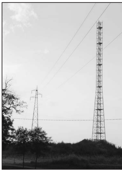
In primo piano il traliccio vicino alla linea dell'Enel.

Infatti, a tutt'oggi, non sono ancora state depositate istanze, né tantomeno sono state rilasciate autorizzazioni, per l'installazione di apparecchiature per telecomunicazioni come prevede L.R. 11/2001 e s.m.i.,