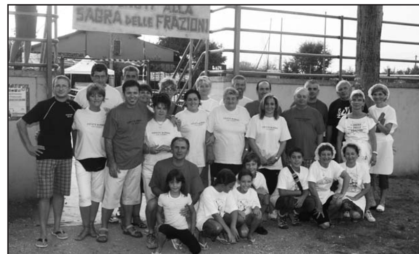
Un gruppo di volontari che hanno sostenuto la festa.