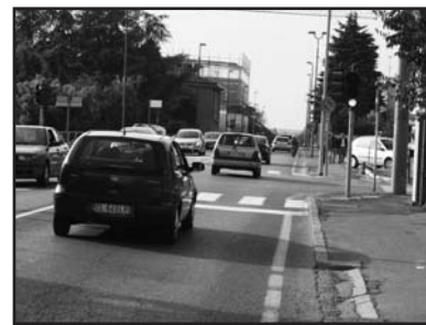
Il segnale che manca all'incrocio.