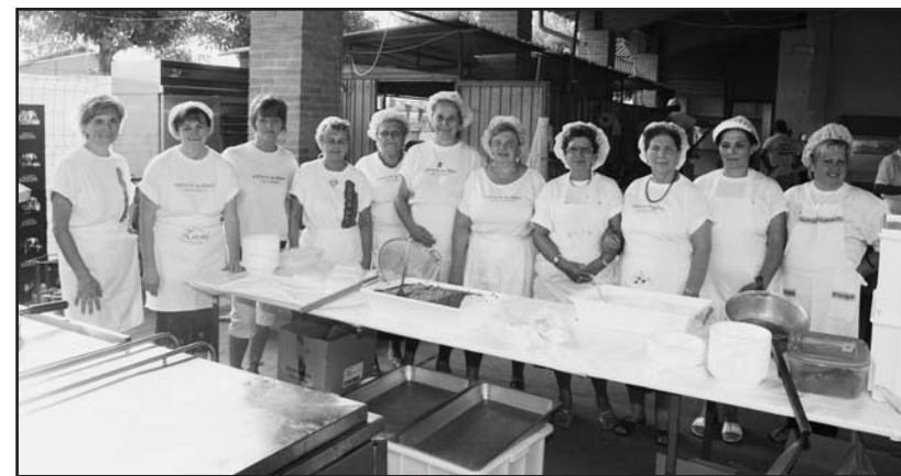
Le "massaie" i pilastrini della festa.