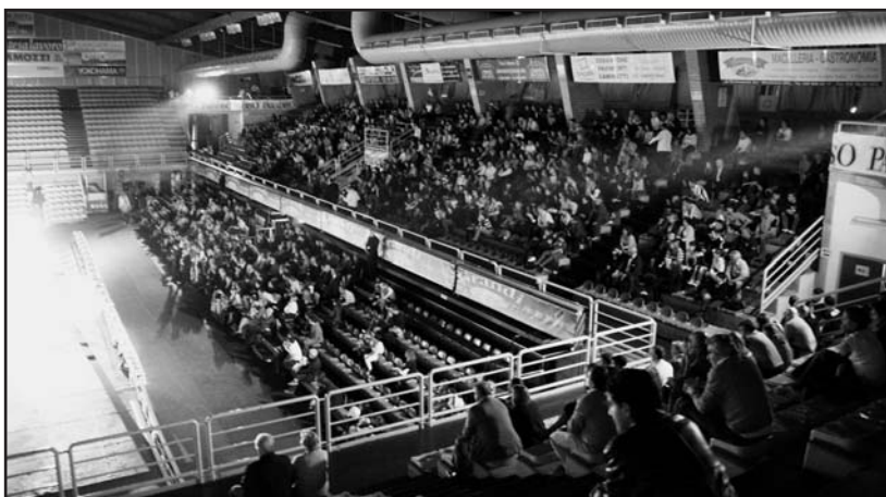
La meravigliosa tifoseria dell'Acqua Paradiso.