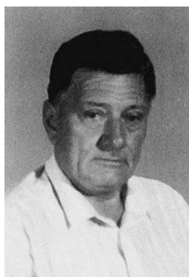
Basiglio Lorenzi 13° Anniversario