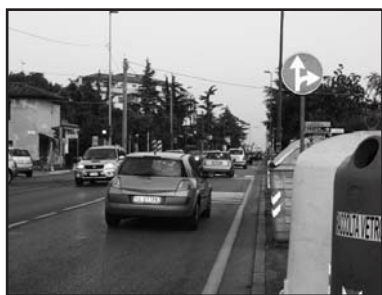
Il segnale da installare nell'altro verso di marcia.