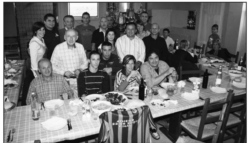
Alcuni tifosi del Milan Club presenti alla cena.